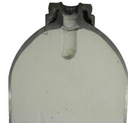
Coupe d'une bouteille de C_2H_2

Malgré le système de sécurité mentionné précédemment, une réaction de décomposition peut se produire à l'intérieur de la bouteille dans certaines circonstances défavorables.